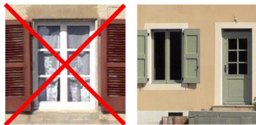
Exemple de teinte possible

Les vernis et lasures ton bois sont déconseillés.