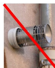
sortie de chaudière : ne doit pas être visible de l'espace public.