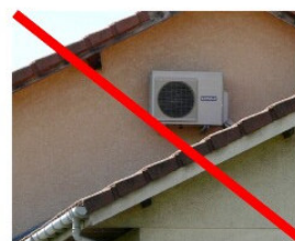
les climatiseurs ne doivent pas être visibles de l'espace public.

- Les boîtes aux lettres et compteurs divers (eau, électricité, gaz...), seront encastrés dans les murs et protégés à l'aide de volets bois.